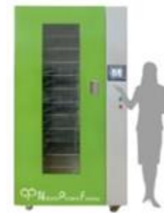
常温食品乾燥機 (産学連携共同開発)