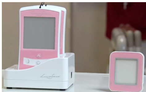
有機ELナースライト