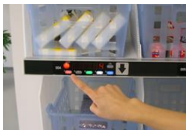
デジタルピッキングシステム (自社ブランド)