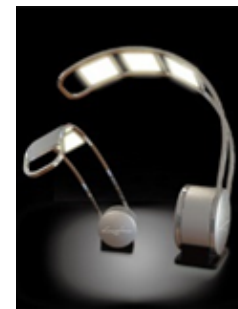
有機ELデスクスタンド (一般医療機器)